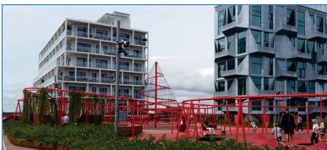
Quartiersgarage mit Spiellandschaft auf der Dachebene