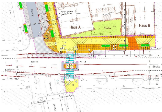
CUV: Lageplan Straßenbau (Auszug)

D ie Cuvrystraße 50-51 Berlin GmbH baute in Berlin-Kreuzberg sieben Gebäude mit überwiegender Büronutzung. Im Zuge des Bauvorhabens wurde eine Querungshilfe neu gebaut, eine Fahrbahn in einem Teilabschnitt erneuert, drei Grundstückszufahrten neu gebaut sowie alle angrenzenden Gehwegbereiche erneuert, inklusive der Neupflanzung von Straßenbäumen. LK Argus wurde mit der Planung der Straßenbaumaßnahmen (LPH 3-5 HOAI) sowie weiteren besonderen Leistungen nach HOAI beauftragt.